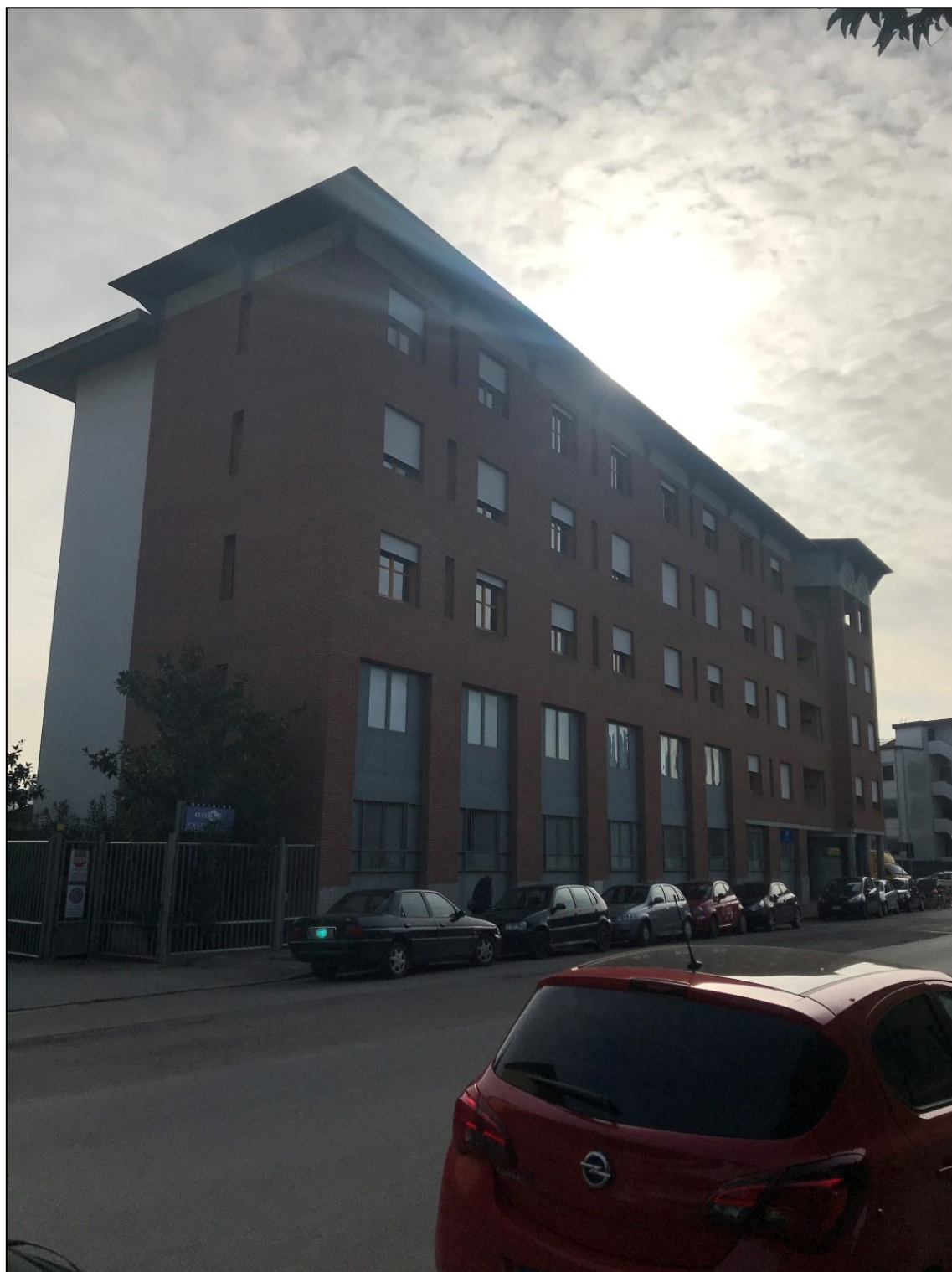
Immagine 3 – Vista da via Fanfani