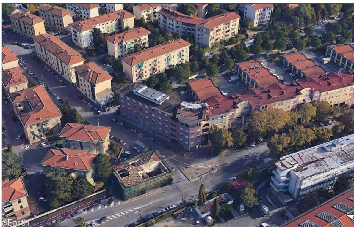
Immagine 2 – Inquadramento aereo assonometrico