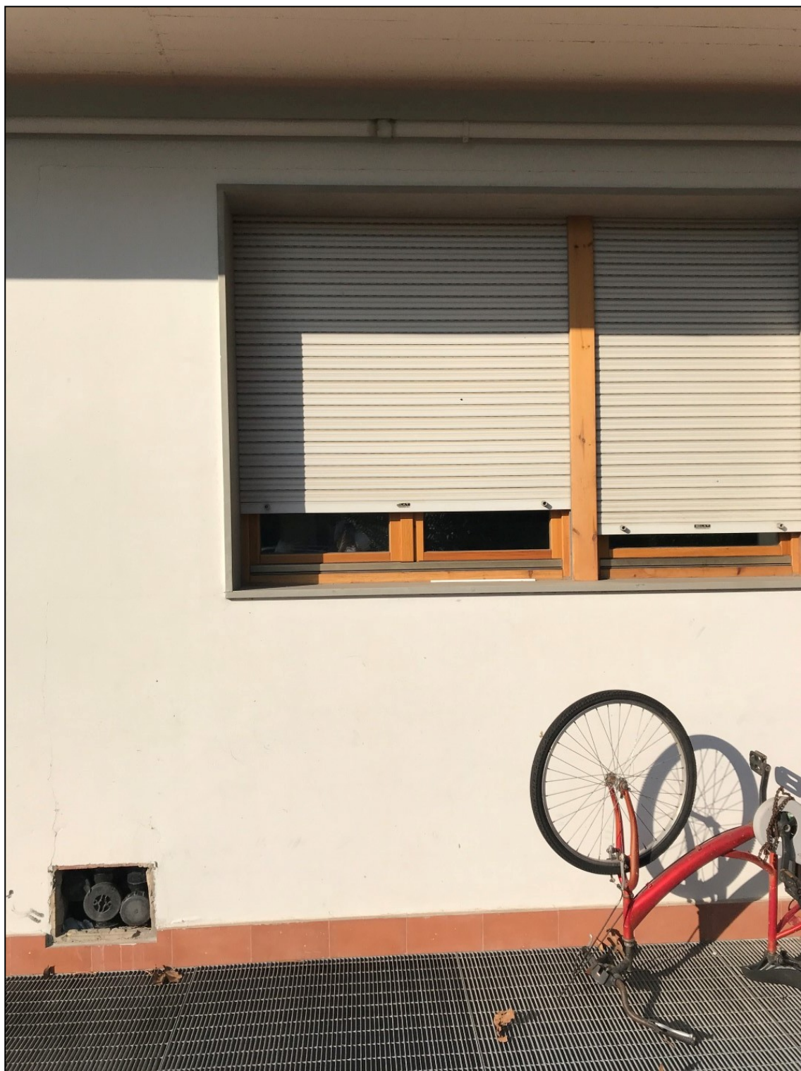
Immagine 7 – Finestra oggetto di modifiche di progetto