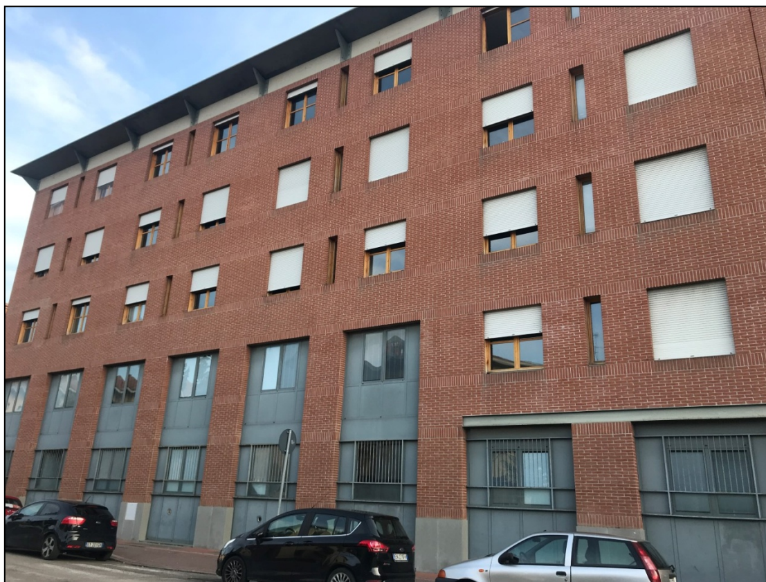
Immagine 4 – Vista da via Fanfani