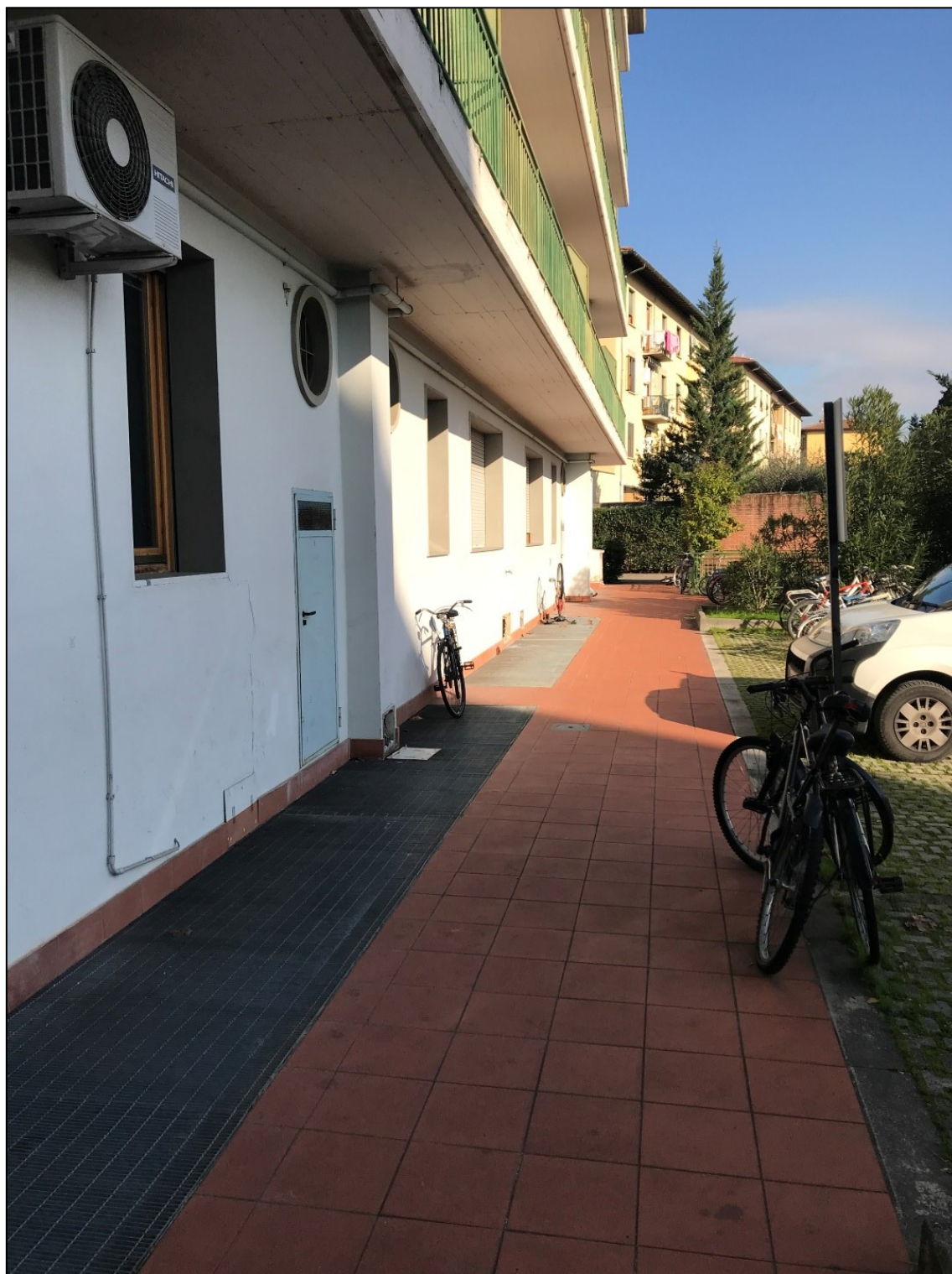
Immagine 6 – Vista dal cortile interno