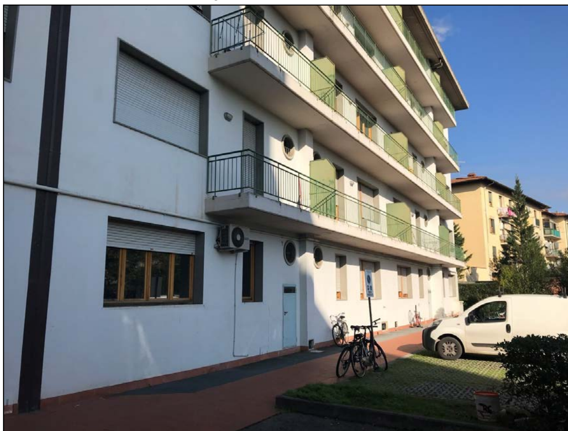
Immagine 5 – Vista dal cortile interno